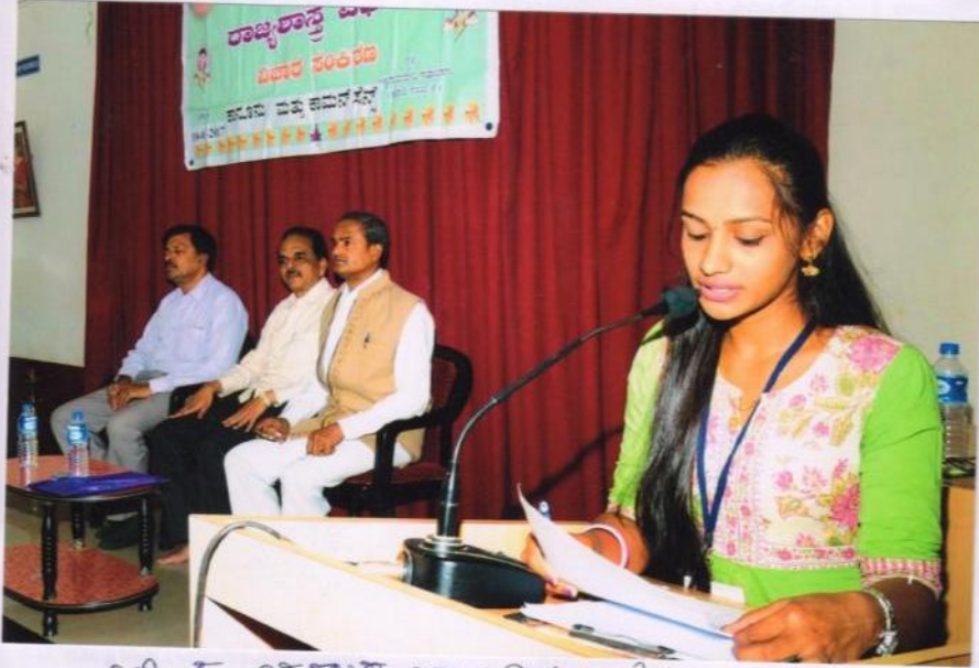
ಎಚ್.ಎಂ. ಕೃಷಿ ಸಂಘದ ಕಾರ್ಯಕ್ರಮವನ್ನು ನಡೆಸಿಕೊಡುತ್ತಿರುವ ಕೃ. ಪ್ರಾಂಶುಪಾಲರ.