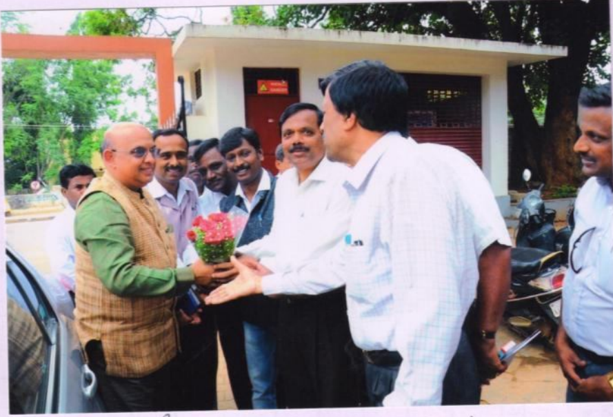
ಕಾರ್ಯಾಗಾರಕ್ಕೆ ಆಗಮಿಸಿದ ಸಂಜೆಸ್ಮಾಲ್ ಪ್ರೆಕ್ಟೀಸಸ್ ವ್ಯಾನ್ ರಿಪುಬ್ಲಿಕನ್ಗಳು .