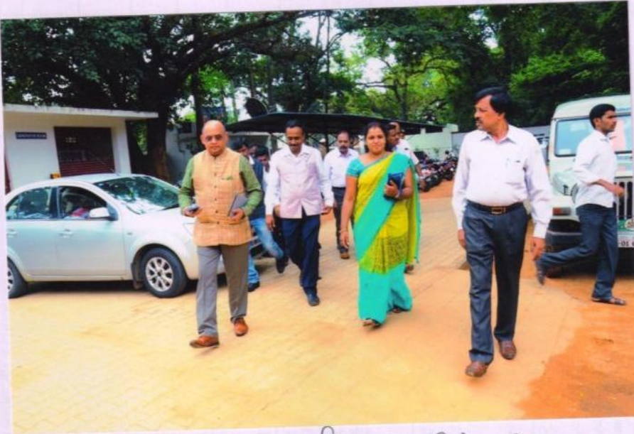
ಪ್ರಾಥಮಿಕ ಪ್ರಾಂಶುಪಾಲರ ಹೊರಹೊರತು ಕೆಳವರ್ಗದ ಸಂಜೆಸ್ಮಾಲ್ ಪ್ರೆಕ್ಟೀಸಸ್ಗಳು .