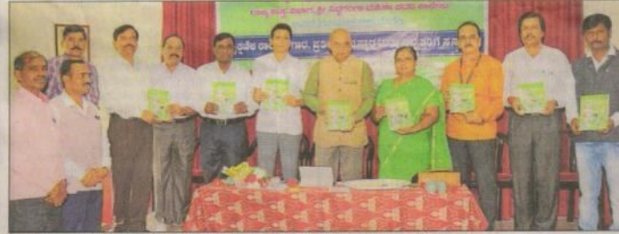
ಕಾರ್ಯಾಗಾರದಲ್ಲಿ 'ರಾಜ್ಯಶಾಸ್ತ್ರ ಮಾರ್ಗದರ್ಶಿ' ಎಂಬ ಪುಸ್ತಕವನ್ನು ಬಿಡುಗಡೆಗೊಳಿಸಲಾಯಿತು