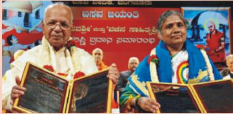
ರಾಷ್ಟ್ರಕವಿ ಶಿವರುದ್ರಪ್ಪನವರಿಗೆ ಬಸವಶ್ರೀ ಪ್ರಶಸ್ತಿ ಪ್ರದಾನ