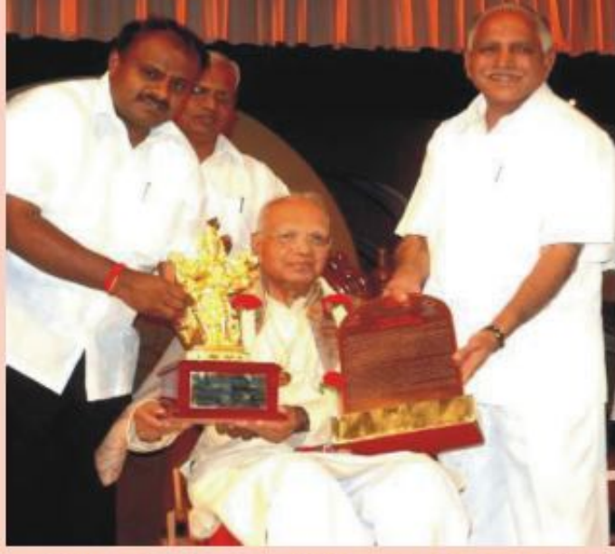
ಕರ್ನಾಟಕ ಮುಖ್ಯಮಂತ್ರಿಗಳಾದ ಶ್ರೀ ಹೆಚ್.ಡಿ. ಕುಮಾರಸ್ವಾಮಿಯವರು ರಾಷ್ಟ್ರಕವಿ ಪದವಿಯನ್ನು ಡಾ. ಜಿ.ಎಸ್.ಶಿವರುದ್ರಪ್ಪನವರಿಗೆ ನೀಡಿದ ಸಂದರ್ಭ ಚಿತ್ರೆಯಲ್ಲಿ ಶ್ರೀ ಜಿ.ಎಸ್. ಯಡಿಯೂರಪ್ಪನವರು ಇದ್ದಾರೆ.