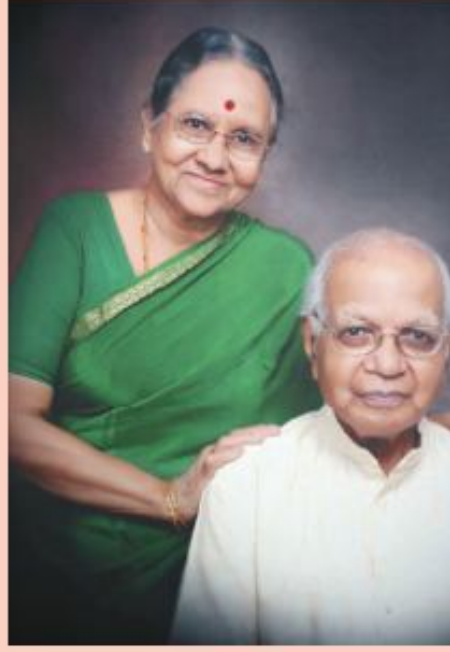
ರಾಜ್ಯಕವಿ ಶಿವರುದ್ರಪ್ಪನವರ ಜೊತೆ ಪತ್ನಿ ಶ್ರೀಮತಿ ರುದ್ರಾಣಮ್ಮನವರು