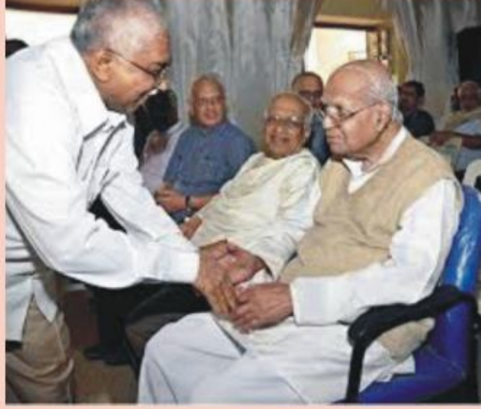
ಜ್ಞಾನಪೀಠ ಪ್ರಶಸ್ತಿ ಪುರಸ್ಕೃತ ಡಾ. ಚಂದ್ರಶೇಖರ ಶಂಭಾರರೂಂದಿಗೆ ಡಾ. ಜಿ.ಎಸ್. ಶಿವರುದ್ರಪ್ಪನವರ ಅತ್ಯಿಲಯ ಸಂಭಾಷಣೆ