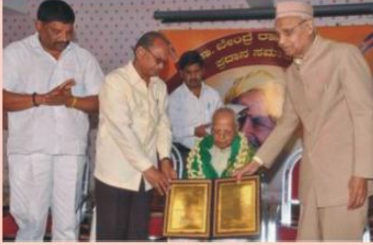
ರಾಷ್ಟ್ರಪತಿ ಶಿವರುದ್ರಪ್ಪನವರನ್ನು ಸನ್ಮಾನಿಸಿದ ಶ್ರೀ ಚನ್ನಬೀರಕಣವಿಯವರು