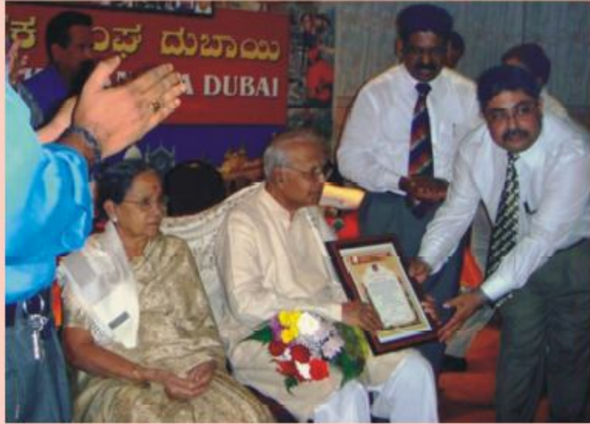
ರಾಷ್ಟ್ರಪತಿ ಶಿವರುದ್ರಪ್ಪನವರನ್ನು ದುಬಾಯಿಯಲ್ಲಿ ಸನ್ಮಾನಿಸಿದ ಸಂದರ್ಭ