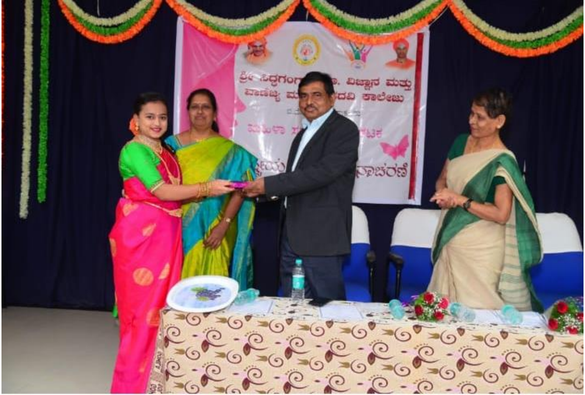
Prize distribution for winners