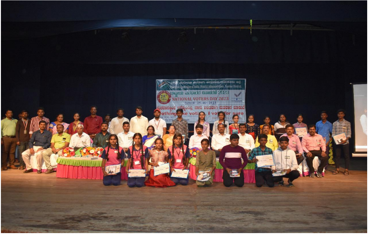
Press Reports on Voters Day Celebration