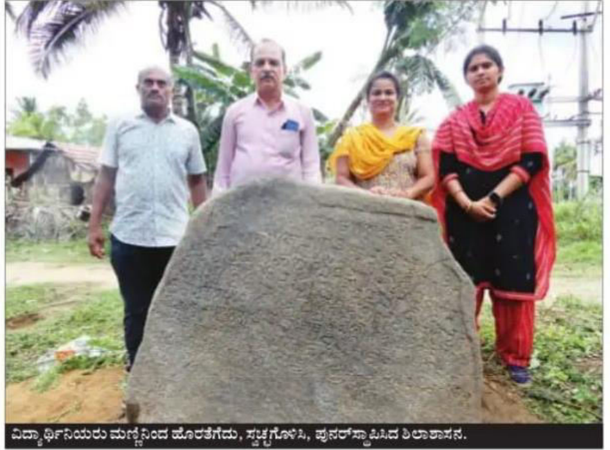
ವಿದ್ಯಾರ್ಥಿನಿಯರು ಮಣ್ಣಿನಿಂದ ಹೊರತೆಗೆದು, ಸ್ವಚ್ಛಗೊಳಿಸಿ, ಪುನರ್ ಸ್ಥಾಪಿಸಿದ ಶಿಲಾಶಾಸನ.

ಹೊನ್ನುಡಿಕೆ ಬಳಿಯ ಜಲಗಾರ ದಿಬ್ಬದ ಬಳಿ ಎಂಟನೇ ಶತಮಾನದಲ್ಲಿ ಚಿಕ್ಕತೊರೆಯೊಂದು ಹರಿಯುತ್ತಿದ್ದು ಅದರ