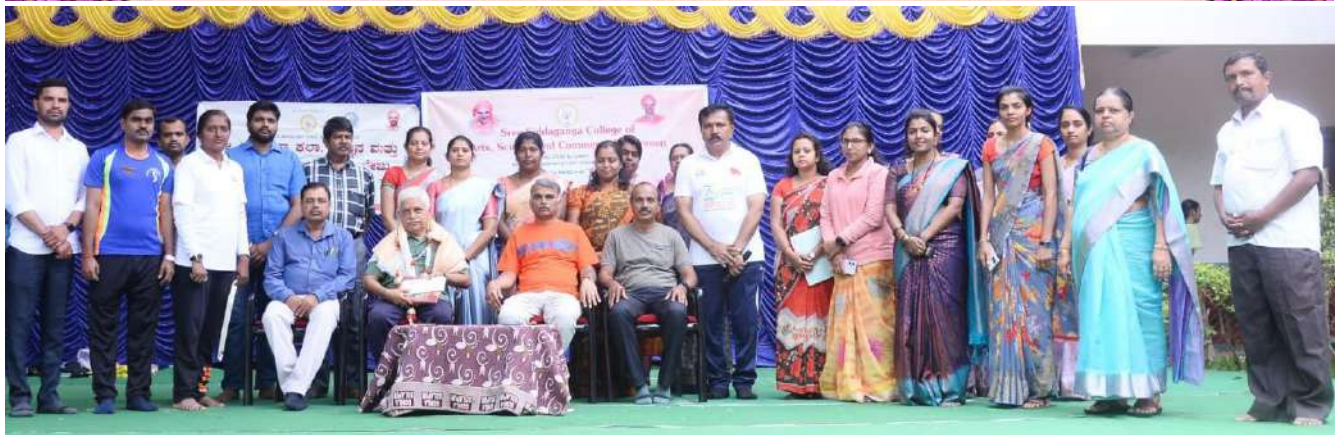
12. 01-07-2023: Doctors Day celebration, Special lecture on the topic of Skin diseases and Blood donation camp.